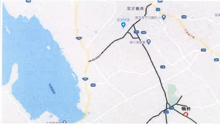
広域地図 宮古空港・サンエー宮古島シティまで車で3分